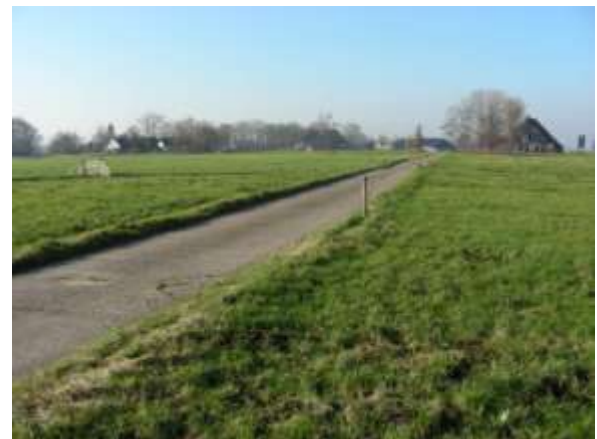
De skyline van Swichum

De hoge boerderijen rondom Swichum zijn zeer beeldbepalend. Gedeputeerde Andriessen noemt ze de 'kathedralen van het Friese platteland'. Provincie en gemeente voeren dan ook een beleid om deze gebouwen voor de toekomst te behouden. Toch hebben de eigenaren te maken met soms zeer hoge onderhoudslasten. De provincie is hierbij behulpzaam met de subsidieregeling 'pas op 'e pleats' voor herstel van boerderijdaken. Ook de gemeente wordt uitgenodigd om een actief beleid te voeren en de eigenaren hierin tegemoet te komen.