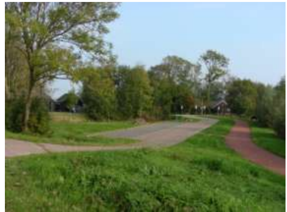
Berm aanvullen met vruchtbomen en/of meidoornhaag

Rondom het parkeerterrein ligt een afscherpende beplanting. Verbetering van het beeld zou bereikt kunnen worden door het in overleg met de gemeente aanplanten van vruchtbomen en/of een meidoornhaag in de berm tussen het fietspad en het parkeerterrein.