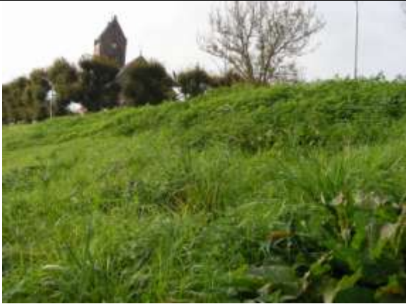
Brandnetels en ridderzuring: indicatoren van verruiging