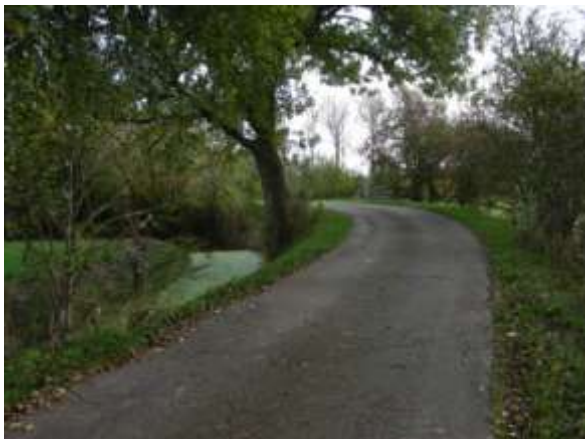
Het einde van de 'Ald Swichumerdyk'

Tot 1864 was Swichum over land alleen bereikbaar over de Ald Swichumerdyk welke van Barrahuis via het Loo naar de noordkant van Swichum liep. Delen van deze oude route zijn nog aanwezig, al is de verkaveling gewijzigd. Het zou mooi zijn deze oude route langs hetzelfde of een vergelijkbaar tracé weer in ere te herstellen. Voor de inwoners van Wirdum en Swichum zou een voetpad tussen Swichum en het Loo de wandelmogelijkheden sterk verbeteren. Hiervoor is in de eerste plaats toestemming van de betreffende grondgebruikers nodig. De provincie stimuleert boerenlandpaden door het betalen van een jaarlijkse vergoeding aan de grondgebruikers en daarnaast door het afsluiten van een aansprakelijkheidsverzekering. Voor inrichtingsmaatregelen zoals een bruggetje over de Wirdumervaart, om- en overstapjes bij hekken en bebording zijn eveneens subsidies mogelijk. Voorgesteld wordt hierover de betreffende grondgebruikers te benaderen.