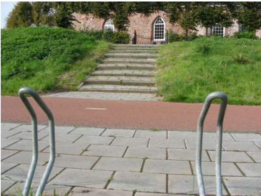
maar er tegenover: uitgezakte trap en fietsenstalling van betontegels

Voorgesteld wordt de bakstenen trap voor de kerk aan de overzijde van de Ayttdyk Door te trekken tot aan het fietspad en ook de fietsenstalling met baksteen te bestraten.