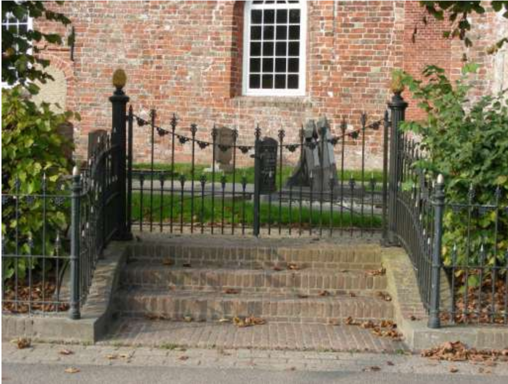
Monumentale ingang naar kerkhof met bakstenen treden .....