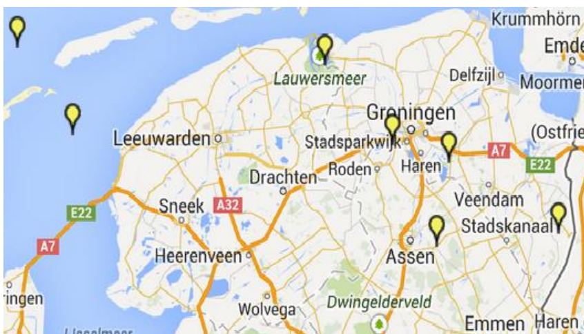
Fig.3.1 Natura 2000-gebieden (gedeeltelijk) in de provincie Groningen

Binnen de provincie Groningen liggen (gedeeltelijk) de volgende Natura 2000-gebieden: Drentsche Aa-gebied, Lauwersmeer, Leekstermeergebied, Lieftingsbroek, Noordzeekustzone, Waddenzee en Zuidlaardermeergebied, zie fig.3.1 Schadebestrijding binnen Natura 2000-gebieden is wettelijk mogelijk mits deze niet in strijd is met de instandhoudingsdoelstellingen van het gebied. Dit faunabeheerplan is hieraan nog niet getoetst. Indien er sprake is van strijdigheid van belangen dan zal dit in het beheerplan van het gebied moeten worden geregeld en/of bij het aanvragen van de vergunning. Hierbij wordt opgemerkt dat de provincie Groningen alleen bevoegd gezag is voor de Natura 2000-gebieden Lieftingsbroek en Zuidlaardermeer. Voor de overige gebieden is dit de provincie Fryslân of Drenthe.