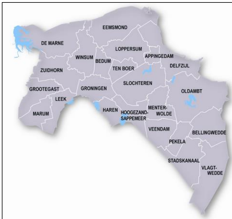
Figuur 2.1. Overzichtskartaal werkgebied met de ligging van de gemeenten in Groningen.